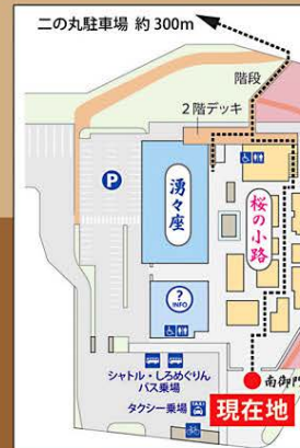
※城彩苑・現在地⇄二の丸広場⑤までの往復所要時間 約30分です。 城彩苑 (熊本城役の馬場リテール株式会社) Tel.096-288-5577