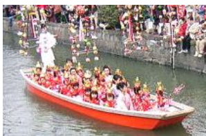
▲かわいい水上パレード

成長を願います。見た目にも鮮やかな伝統の雛祭りを観光客にも一緒に楽しんでもらおうと、初節句の家庭が一般公開を試みたのが「さげもんめぐり」です！ 今年の開催期間は2月11日(木)〜4月3日(土)。柳川市の観光協会では、展示場所やイベントの詳細を載せたさげもんめぐりマップをご用意しています。期間も長いので、足を運んでみてはいかがでしょう？