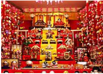
▲豪華に飾った雛壇

とくに柳川の雛祭りは、色とりどり「さげもん」と呼ばれる飾りを部屋いっぱいにつり下げ、とても華やか！開催期間中はお内裏様とお雛様に扮した稚児達の水上パレードなどイベントも多く、盛大なお祭りなんです！