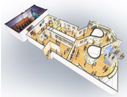
▲龍馬伝館(イメージ)

皆さん、こんにちは！寒い季節が続きますが、いかがお過ごしですか？今回は、今とても熱い！NHKの大河ドラマ「龍馬伝」についてスポットを当ててみたいと思います！福山雅治さん演じる坂本龍馬、とってもカッコいいですよね☆