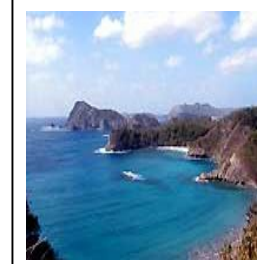
▲小笠原諸島の父島

小学校5年生 男子かっの投稿です☆ 『僕は小笠原諸島の硫黄島付近に皆既日食を見に行った。皆既日食の少し前に辺りが暗くなり始めて、みんながカメラや観測用のグラスを構えて待った。その時、ダイヤモンドリングが少し見えて、皆既日食が始まった。時間は4分半あった。その後、今度はダイヤモンドリングがハッキリきれいに見えた。4分半は短かったよな長かったような不思議な感じだった。その帰りに10頭くらいのイルカと泳いだ。イルカは思ったより大きく2〜3メートルの大きさがあった。とても人なつっこく自分から近づい