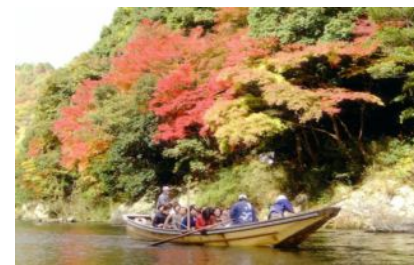
▲保津峡の紅葉と保津川下り

秋の京都って誰もが一度は行ってみたいものですよね!今回は秋の京都のオススメスポットをご紹介します!