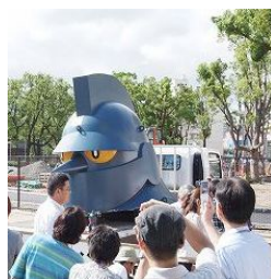
▲観客からは思わず歓声が！

10月4日には完成式典が予定されており、新たな観光名所としても今後大注目です！神戸の街を見守る正義のヒーローにひと目会いに行ってみてはいかがでしょう？