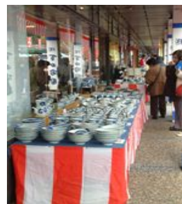
▲秋の陶磁器まつりの様子

11月21日(土)から25日(水)にかけて「秋の有田陶磁器まつり」が開催されます。有田でお祭りと言えば、GWに行われる「有田陶器市」が有名ですよ!このお祭りはその陶器市とは対照的な特徴を持っています。まず、その違いをご説明いたしますね!