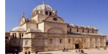
シベニクにあるカトリックの大聖堂。レンガや木の補助を全く使わず建てられた石造建築の教会としては、世界で一番大きい教会です。

気候が続き、気温も肌寒い程度で、過ごしやすい気候です。さらに、クロアチア共和国は温泉の宝庫なのです。北部のストラヴォニアからザグレブ近郊とイストラ半島にかけて至るところで温泉が湧き、ホテルや保養施設や療養所が安い料金で多様なサービスを提供しています。日本とは違いクロアチア共和国の温泉は、室内の広いプールで水着を着けて長時間ゆったり過ごすのが主流です。また、クロアチア共和国には、7つの世界遺産があります。今回は3つの世界遺産をご紹介します。