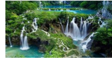
大小切り立った峡谷に16の湖と92ヶ所の滝が点在している公園です。