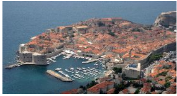
「アドリア海の宝石」と呼ばれ、ヨーロッパではもっとも美しい地中海都市のひとつとされています。