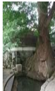
「鏡ヶ池の恵比寿様」