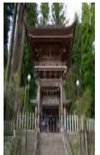
「けやき水源水神様」

熊本県阿蘇郡小国町には一 等くじが次々に当たったとい う、ご利益のある神様がいる ことを「存じて」しようか。 「小国両神社」