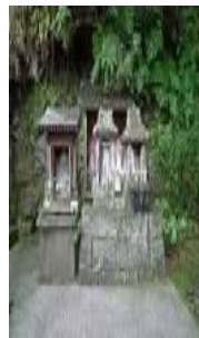
「小国両神社、けやき水源水神様、鏡ヶ池の恵比寿様」

それぞれに、古くからご利益のあったお話も残りますし、実際にこの神様たちに願をかけ、見事に宝くじを当てた人も多くいますよ! 運気を上げたい方は「福運三社」に備え付けてあるスタンプを集め、福銭交換店にて「福銭」を借りることが出来る「小国福運三社めぐり」がお薦めです!「福銭とは?」商売繁盛や宝くじ当選、福運招来などのお守りです。良いことがあれば、お礼参りで返却するのが習わしです。 開運パワースポット!皆様にも御利益があるかもしれませよ。