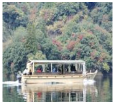
※水位によって運航時期が異なります

開催日 5月22日(土) 23日(日) 花火打ち上げ予定 19:40~ 21:30 ※花火大会は天候によっては延期となります