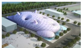
▲日本館完成イメージ

日本からは敷地面積約6000㎡の日本館パビリオン「紫雲島(かいいこじま)」を出展しています。遣隋使の時代を中心とした日中の歴史と文化の繋がりを、現在の共通課題である環境問題への取り組みと最先端技術を3つのゾーンに分け、ロボット・漫画・CG・ミュージカルなど多彩な展示方法で表現しています！また上海までは福岡から直行便で約1時間半、空港からは時速431kmの世界最速のリニアモーターカーが市内まで繋がってとても便利！今年話題の上海万博に大注目です！