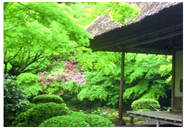
▲爽やかな新緑の九年庵

野趣に富んだ数寄屋造りの邸宅と6800㎡の庭園には、もみじを中心に約60種700本の樹木が植栽されていて、鮮やかな黄緑の新芽が茂り頭上に広がります。また、地面一面は約40種類のコケが敷き詰められ、まるで深い緑の絨毯