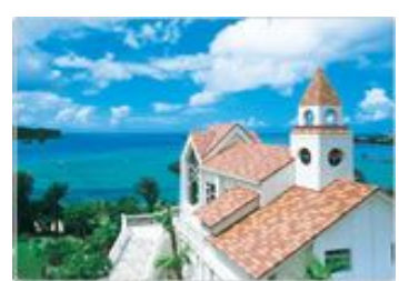
▲コーラルヴィータ・チャペル(沖縄)

リゾートウエディングと言えばハワイやグアムなど海外を想像しがちですが、このところ 国内のリゾートウエディング が人気を集めています！特に人気の高い主な場所は 沖縄 や 北海道 ・ 軽井沢 などです。国内リゾートウエディングが人気の理由としてまず挙げられるのが、 リゾート地に魅力的な結婚式会場が増えてきた事 です。海や雄大な景色など海外にも負けないロケーションはあるのに、肝心の結婚式会場に満足がいかにずい諦めるパターンが今までは多かったようです。しかし最近では、 海外に負けないような結婚式会場 が続々と誕生しています。 次に、同行する親のことを考える国内にする人が多いようです。海外旅行が好きで旅慣れた人は別として、海外は言葉や習慣も違うし、 親にとって不慣れなもの になってしまいます。そんなと必然的に自分たちが準備でなくてこまいでも、両親や親戚の面倒を見ないといけない事