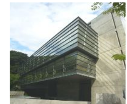
▲坂の上の雲ミュージアム

近年ではリピーターも多く現地は大混雑！宿泊はどこもキャンセル待ち。しかし！そんな風の盆を見る絶好のチャンスが！ 毎年、広島県竹原市の湯坂温泉郷で定期公演を行うのでこのチャンスです。今年はなんと9月19日、20日の二日間！会場や開演時間など詳細はお気軽にお問い合わせ下さい。興味のあ