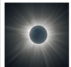
▲皆既日食(写真はイメージです)

2009年7月22日(水)、小笠原諸島をはじめ、九州内では鹿児島県十島村(下カラ列島)の悪石島(あくせきじま)付近を中心に、屋久島の北部と種子島の南部、奄美大島奄美市名瀬付近の地域内で、継続時間が今世紀最大の皆既日食を観測することが出来ます。鹿児島県内で皆既継続時間が最も長い悪石島では、今世紀最大と言われ6分25秒も観測できるほか、屋久島南部で4分程度、奄美大島北部で3分程度観測出来ます。日本の陸地に限ると、皆既日食が観測出来るのは1963年7月21日の北海道東部で見られた皆既日食以来、実に46年ぶりです！今回は2035年9月2日の北陸・北関東などで見られる皆既日食まで こんな希少な現象は日本だけではなく、中国でも観測することが出来ます。見学可能地域の多くが海上である中、中国では沿岸部の上海から内陸の武漢・重慶までの広い地域で、陸地での見学が可能で、なおかつ、約5分間にもわたって皆既日食が楽しめます！天文学の専門家が同行し、詳しい説明をしてくれる中国行きの「皆既日食観測ツアー」もぞくぞくと登場しています。この夏注目になる事間違い無し！