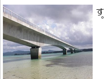
▲延長 2,020m の古宇利大橋