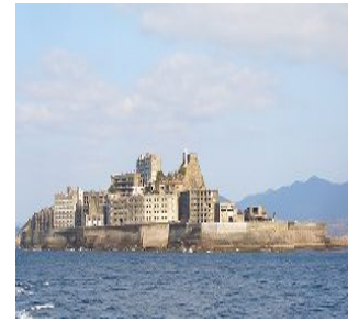
▲ 沖合い約19kmに浮かぶ島

無人島端島(はしきま)。周囲は約1200mと小さな島ながら、高層鉄筋アパートが林立する姿は軍艦「土佐」に似ていることから、軍艦島と呼ばれるようになった。